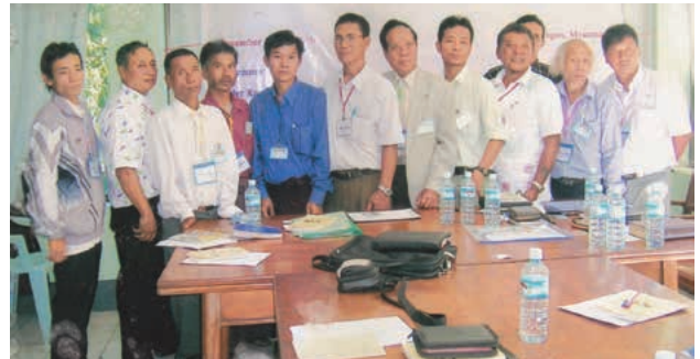
Cuerpo Ejecutivo Nacional de Myanmar (2010) La solicitud de esta conferencia para ser miembro del CMI fue pasada por alto en el congreso de 2012. Consideramos que es un participante de pleno derecho hasta que su solicitud sea manejada oficialmente.