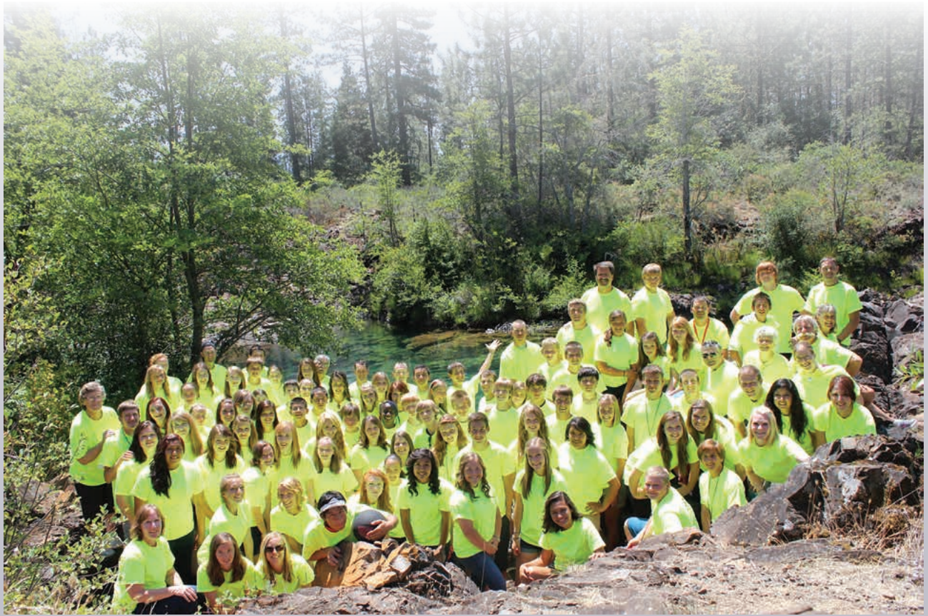
SIS-Q Meadows, Oregon 2012